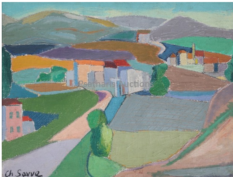
Χριστόφορος Σάββα, Τοπία στη Νότια Γαλλία , Αρ.Κατ. 50

Στον αριθμό 33 δεσπόζουν τα Σπίτια στ' Αβρίλλη , Ο μεγάλος πεύκος , Δύο δρύδες στη «Γύρωνα» του Τηλέμαχου Κάνθου . Το έργο παρουσιάζει την ιδιαίτερη παλέτα του κυπριακού ορεινού τοπίου που τόσο μαστορικά αποτύπωσε στα έργα του ο Κύπριος καλλιτέχνης. Τα χίλια πράσινα και τα μαβιά, μενεξεδιά και γαλάζια του Κάνθου αποτελούν δείγμα ζωγραφικής ποιήσης και αρμονικής αποτύπωσης του τοπίου της ιδιαίτερης του πατρίδας. Ακολουθούν άλλα τρία έργα του ίδιου καλλιτέχνη, η Ελιά και η Αποθήκη , τα Χαμόσπιτα και το Άνοιγμα στον Κάμπο . Στα τρία έργα αποτυπώνεται η ίδια χρωματική σοφία του καλλιτέχνη αλλά και ικανότητά του να παράγει όγκους μέσα από επίπεδα, σχεδόν, χρώματα και μέσα από τα παιχνίδια της σκιάς και του φωτός. Ακολουθούν έργα των Πολύκλειτου Ρέγκου , Λευτέρη Οικονόμου και ένα λάδι και δυο παστέλ του Σπεράντζα .